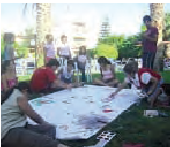
Τα παιδιά Ε/Κ και Τ/Κ ζωγραφίζουν για την ειρήνη και την επανένωση της πατρίδας μας, στην κοινή εκδήλωση στα αναπαυτήρια της ΠΕΟ στα Περβόλια.

Με τη συμμετοχή ελληνοκυπριακών και τουρκοκυπριακών οικογενειών, τα Τμήματα Γυναικών Εργατοϋπαλλήλων της ΠΕΟ και της τ/κ DEV-IS οργάνωσαν το Σαββατοκύριακο σειρά δραστηριοτήτων με τίτλο "Ο ρόλος της γυναίκας στις δύο κοινότητες στον αγώνα για ειρήνη, επανένωση και καλλιέργεια κλίματος συνεργασίας". Οι δραστηριότητες οργανώθηκαν στους χώρους των εργατικών αναπαυτηρίων της ΠΕΟ στα Περβόλια και σημείωσαν απόλυτη επιτυχία.